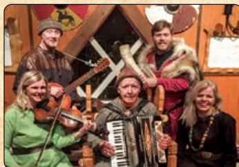
Víkingasveitin leikur fyrir matargesti eins og þeim einum er lagið