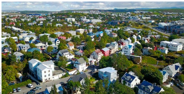
Ljóm: Guðni Gleason

Á sama tíma lágu fyrir óskir 46 skjólstaðinga um flutning í annað félagslegt leiguhúsnæði en eftir að óskað hafði verið eftir að umsókn væri endurnýjuð fækkaði á listanum því aðeins 14 af þessum 56 brugðust við og sendu inn umsókn um flutning.