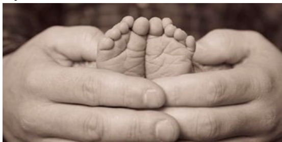
Foreldri kemst ekki í vinnu á meðan ekki fæst vistun.