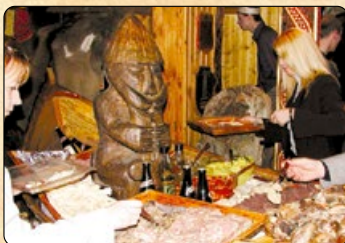
Gerum tilboð fyrir hópa í gistingu og mat