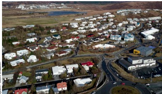
Litl. Guðni Glaason Hluti Setbergshverfis og Urriðakotsvatn.

Á fundinum var einnig hugur í fólk að taka upp nágrannavörslu.