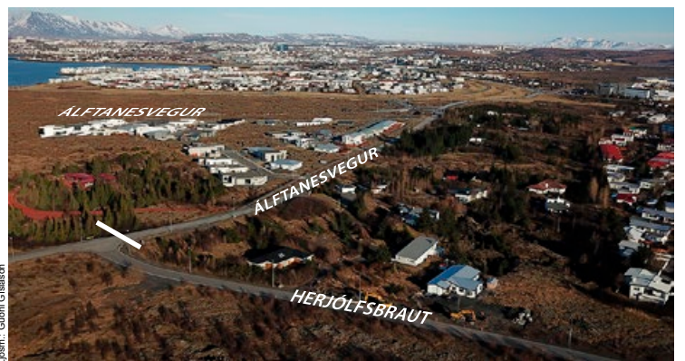
Hér á mótum Herjólfsbrautar og Álftanesvegur vilja yfirvöld í Garðabæ loka til austurs til að takmarka umferð meðfram húsum í Þrýðishverfinu.

auka akstur um íbúðagötur í Norður- bænum.