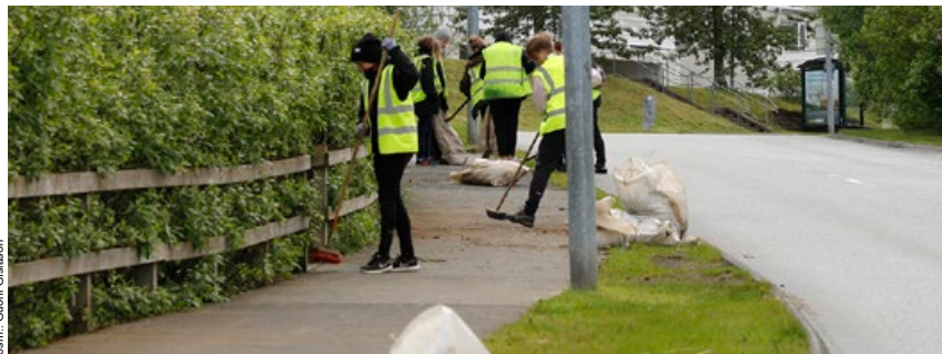
Unglingar við hreinsunarvinna við Hlíðarberg.

útbreiðslu lúpínu sem íbúar hafa lýst áhyggjum yfir þar sem hún vex innanbæjar, nálægt íbúðarhúsum.