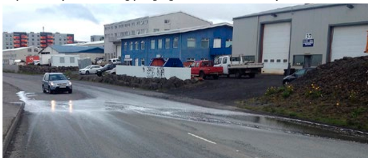
Fiskimengað vatnið rennur óhindrað yfir Hvaleyrarbrautina.

Hann segist hafa kvartað yfir þessu við starfsmenn bæjarskrifstofunnar við