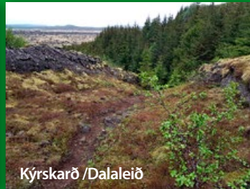
Kýrskarð / Dalaleið