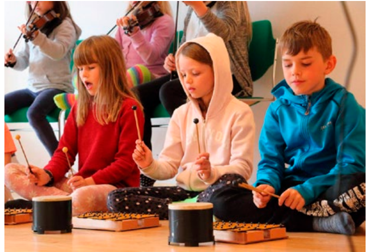
Frá sönghátíðinni í Hafnarborg 2017.

9.-14. júlí verður söngsmiðja fyrir krakka á aldrinum 10-12 ára, sem elska að syngja og spila tónlist! Þau fá þjálfun í að læra lög eftir eyranu, búa til eigin útsetningar, syngja í röddum, syngja í keðjusöng og að semja sín eigin lög. Íslensk þjóðlög og þjóðsögur verða rauður þráður í gegnum námskeiðið