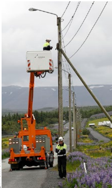
Kaldárselsvegur. Brátt munu tréljósastaurar með loftlinum heyra sögunni til í Hafnarfirði.