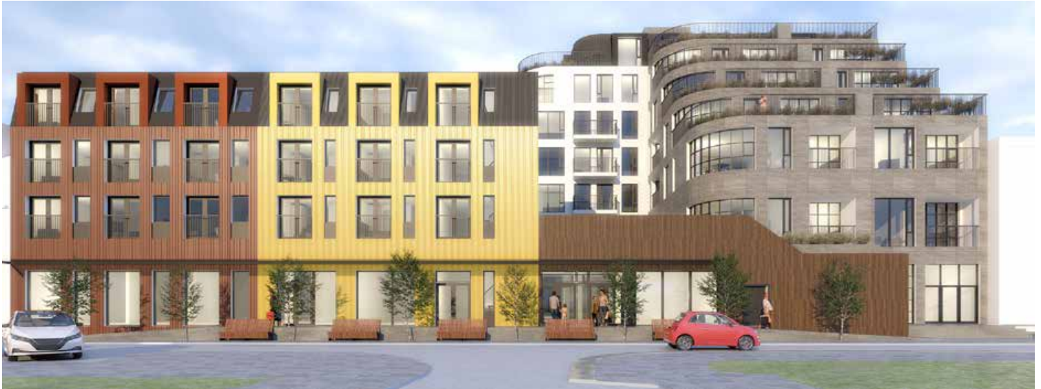
Götumyndin, séð frá Gunnarssundi, þar sem framhliðin er vel brotin upp í minni einingar.

Gert er ráð fyrir að uppsteypa ofanjarðar hefjist strax á næsta ári og að hratt verði unnið til að minnka rask í miðbænum og til að starfsemi í húsneðinu geti hafist sem fyrst.