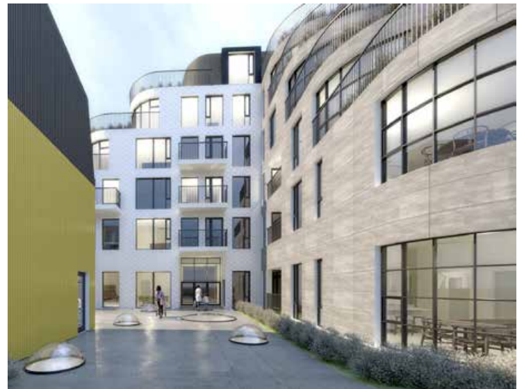
Ganga má beint inn í Bókasafnið af þakgarðinum á 2. hæð