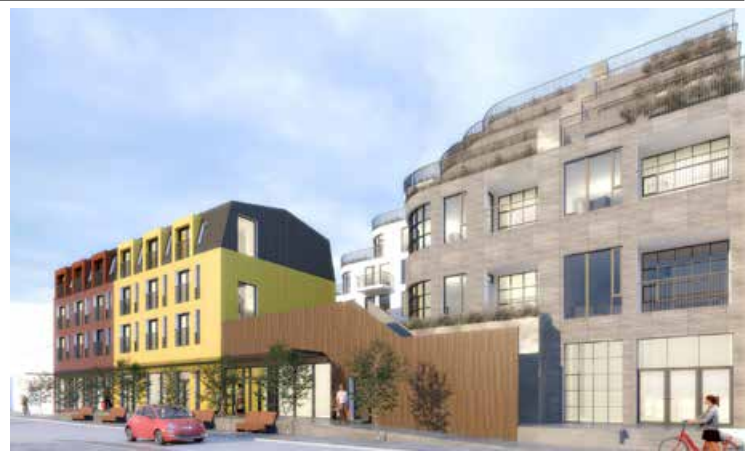
Í raun má sjá fjögur hús að Strandgötunni.