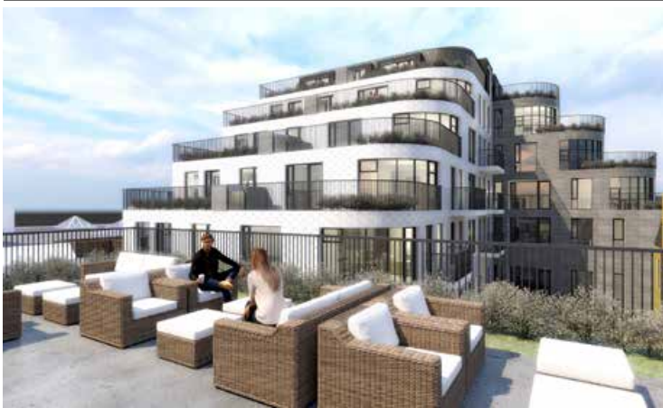
Þakgarðar munu einkenna íbúðahlutann.