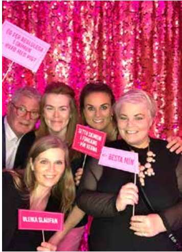
Starfsfólk Krabbameinsfélagsins hvetur fólk til að kaupa bleiku slaufuna.

Árlegt árvekni- og fjáröflunaráttak Krabbameinsfélags Íslands, Bleika slaufan, undir slagorðinu „SÝNUM LIT“ er hafið. Bleika slaufan er tileinkuð baráttunni gegn krabbameinum hjá konum.