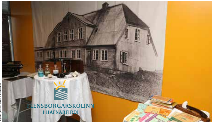
Gamla Flensborg og munir úr sögu skólans.

Um 16 ára skeið, frá 1892 til 1908, var sérstök kennaradeild við skólann og þar fór fram fyrsta skipulagða námið fyrir kennara á Íslandi. Þegar Kennarskóli Íslands var stofnaður í Reykjavík var kennaradeildin í Flensborg lögð niður. Eftir það starfaði skólinn eingöngu sem gagnfræðaskóli, fyrst sem sjálfseignarstofnun, en árið 1930 tóku ríki og bær í sameiningu við rekstri hans.