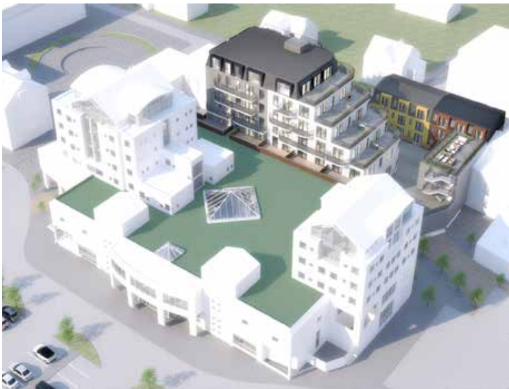
Hér sést núverandi verslunarmiðstöð og viðbyggingin við Strandgötu